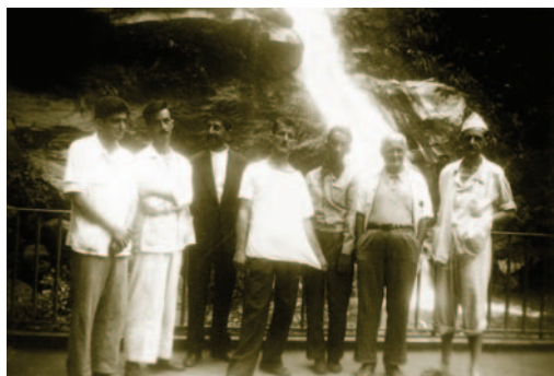
Atividade terapêutica – Passeio à Floresta da Tijuca com os clientes

O programa traz ainda produções ficcionais, como o quadro “Nós somos o IPP” e outros, que tratam com humor de temas do dia-a-dia dos usuários do instituto.