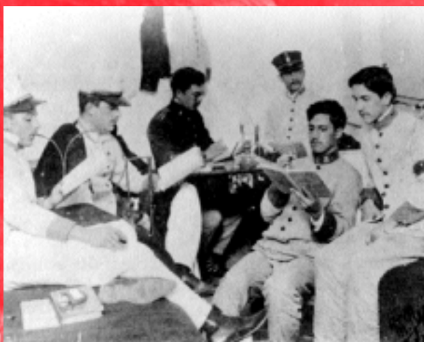
Grupo de cadetes da Escola Militar em 1904.