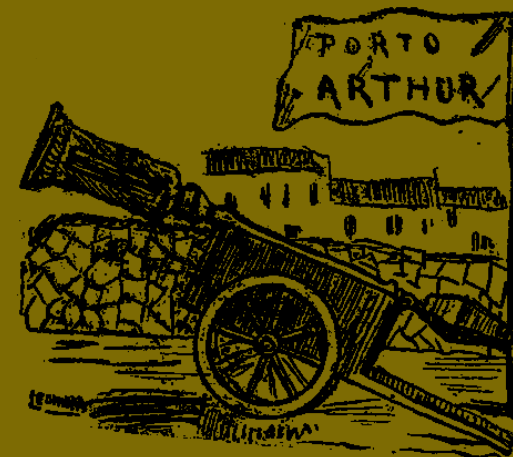
"Relíquias de Porto Arthur" O Malho , dezembro de 1904.

Chegam os batalhões de Minas e São Paulo. A polícia pede à Marinha que ataque os rebeldes da Saúde pelo mar. Famílias começam a fugir com medo do bombardeio.