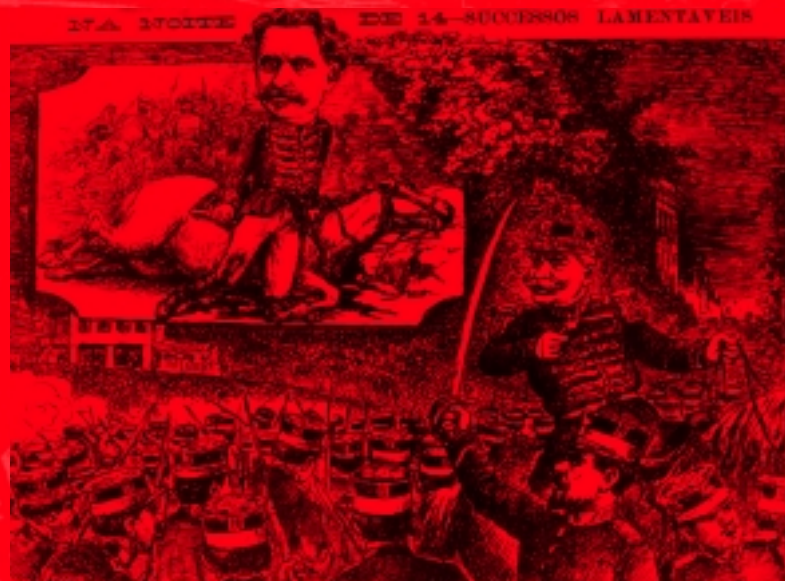
*Na noite de 14: O Malho, novembro de 1904. Acervo da Fundação Casa de Rui Barbosa.

Cerca de 300 cadetes saem da Escola em direção ao Palácio do Governo para depor o presidente. No caminho, recebem a adesão de um esquadrão da Cavalaria e uma companhia de Infantaria. Na Rua da Passagem, encontram-se com as tropas governamentais. Segue-se um intenso tiroteio. O general Travassos sofre ferimentos graves e morre dias depois. Lauro Sodré também é atingido. A debandada é geral. Os cadetes retornam à Praia Vermelha. O governo tivera 32 baixas, nenhuma fatal. Os rebeldes, três mortos e sete feridos.