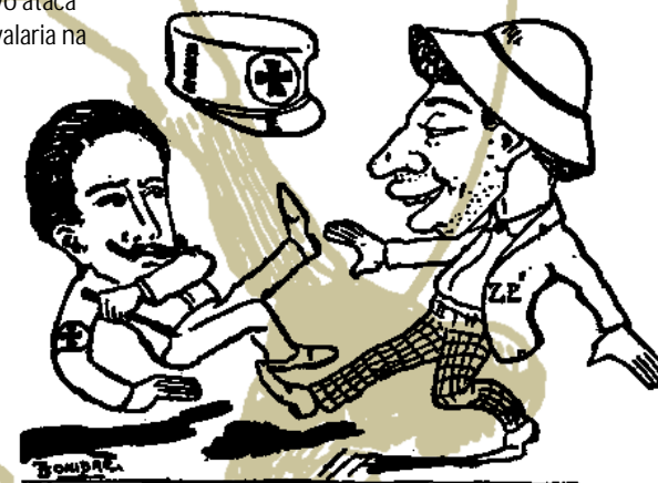
“Vacina Obrigatória.” Correio do Brasil , outubro de 1904. Autor: Leônidas. Acervo Casa de Oswaldo Cruz.

O conflito generaliza-se e assume um caráter mais violento. A multidão luta a Praça Tiradentes e não atende à ordem de dispersar. A cavalaria investe e o local se torna uma praça de guerra. Tiros partem dos dois lados. A luta se espalha pelas ruas adjacentes. Pessoas caem mortas e feridas. A população incendeia bondes, quebra combustores da iluminação e vitrines de lojas. O centro da cidade enche-se de barricadas. Prostitutas da Rua São Jorge entram em choque com a polícia. O povo ataca delegacias e o quartel da Cavalaria na Frei Caneca. Os distúrbios se espalham e chegam à Tijuca, Gamboa, Saúde, Botafogo, Laranjeiras, Catumbi, Rio Comprido e Engenho Novo.