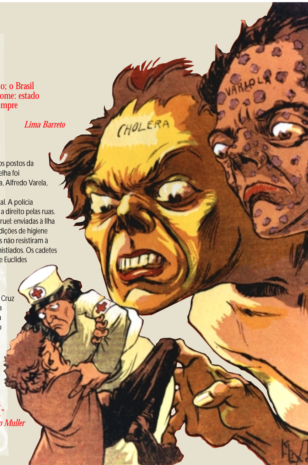
“Colera de Bexiga.” O Degas outubro de 1908. Autor: Calixto.