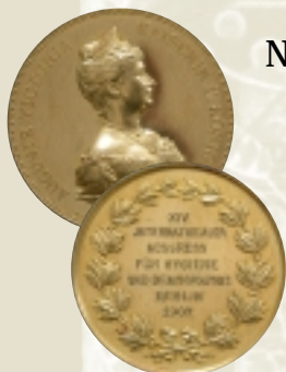
Medalha de ouro recebida por Oswaldo Cruz no XIV Congresso de Higiene e Demografia, em Berlim, 1907.