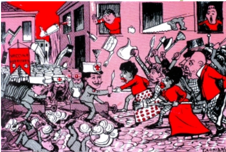
“Guerra Vacino Obrigateza.” O Malho, outubro de 1904. Autor: Leônidas.

A polícia, que recebera ordens de proibir reuniões públicas, tenta prender um grupo de estudantes que pregava resistência à vacinação. A população reage com pedradas e é espancada. Ocorrem as primeiras prisões.